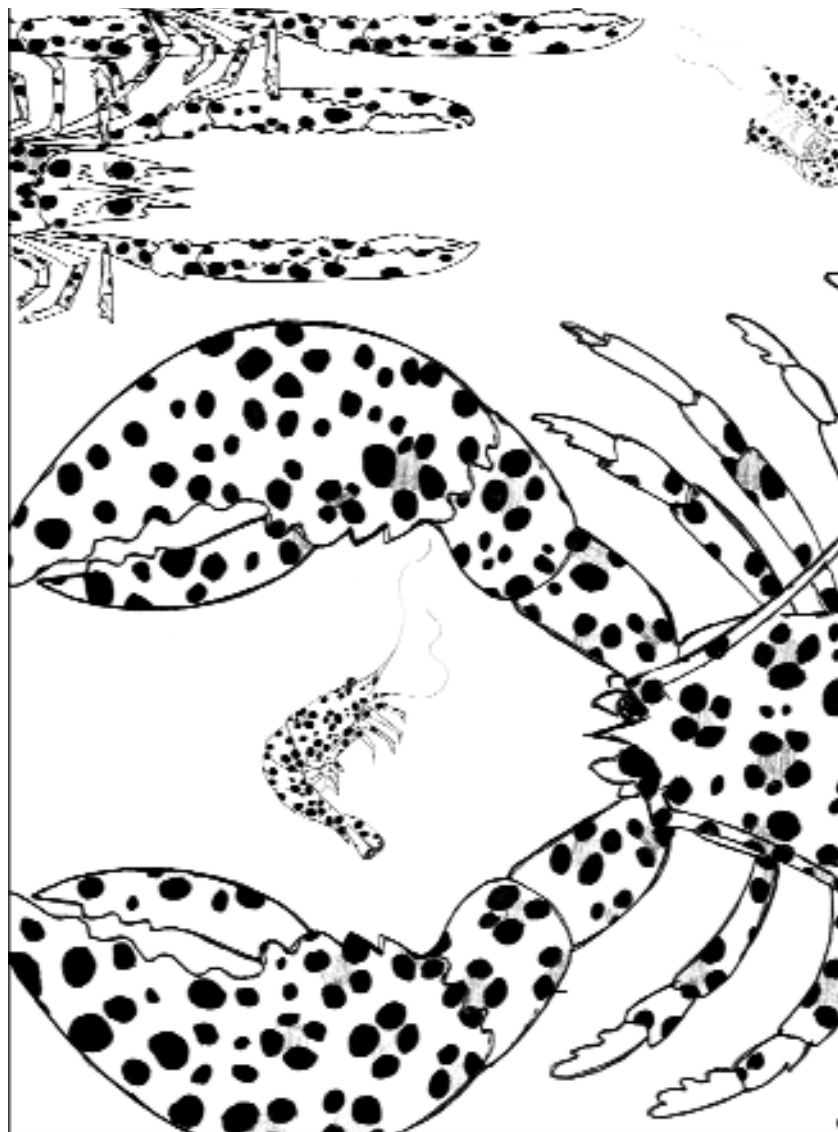
Tistel föredrar hummer framför kräftor och räkor